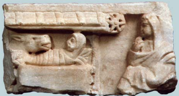
Fragment de tapa de sarcòfag amb la Nativitat, s. IV dC (Museus Vaticans, Museu Pius Cristià)

Cites d'alguns dels textos que estan a l'arrel d'aquest escrit: 1. Porta fidei I: Ap 1,8; Mt 2,4-5; Ml 5,1,3; Jn 1,14; Jn 6,40; Lc 2,15. / 2. Lc 2,7-20; Mt 2,10-11. / 3. Lc 2,6,12; Mc 9,34-35; Mc 10,41,44-45. / 4. Lc 2,16,19,51; Lc 1,29,35,38; Jn 16,13. / 5. Mt 5,8; Lc 8,21; Lc 11,28; Jn 6,51,54-55. / 6. Lc 1,31-35; Sl 139,13,15; Is 44,2,24; Is 49,1; Jr 1,5; Jb 10,10-12; Ga 1,15; Jn 14,23. / 7. Lc 1,41-42,44-45; Mt 1,20-21,24; Mt 2,13-14; Jn 2,5.