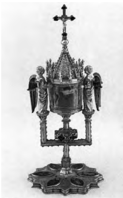
Reliquiari de Sant Fructuós de la Catedral de Tarragona.

El reliquiari de Sant Fruitós de Bages, al igual que el de Tarragona, és d'estil gòtic. Es compon de peu amb forma circular i presenta al cos central una lúnula o viril, on envoltat de rajos, es conserva la relíquia de Sant Fructuós al centre. El reliquiari està coronat amb un pinacle, element molt característic de l'arquitectura gòtica.