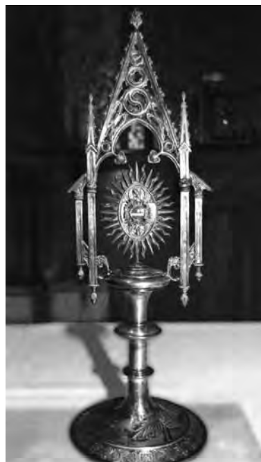
Reliquiari de Sant Fruitós de Bages.