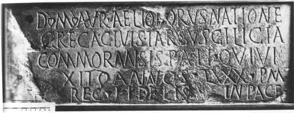
Fig. 5. Inscripció d'Aureli Heliodor.

Concretament, ens situem cap a l'any 392 dC, una època on tot sembla indicar que Tàrraco s'ha convertit en un centre important de pelegrinatge de les comunitats cristianes en general. També és un moment en què la necròpolis del Francolí mostra un auge considerable, generat a partir del segle anterior pel costum de la població tarraconense d'enterrar els seus difunts prop de les tombes dels màrtirs.