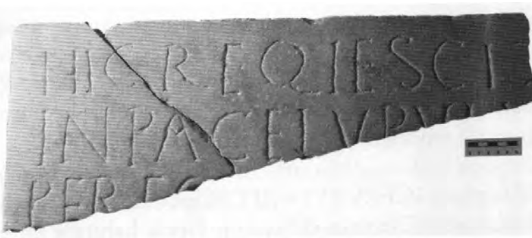
Fig. 1. Inscripció de Lúpul.