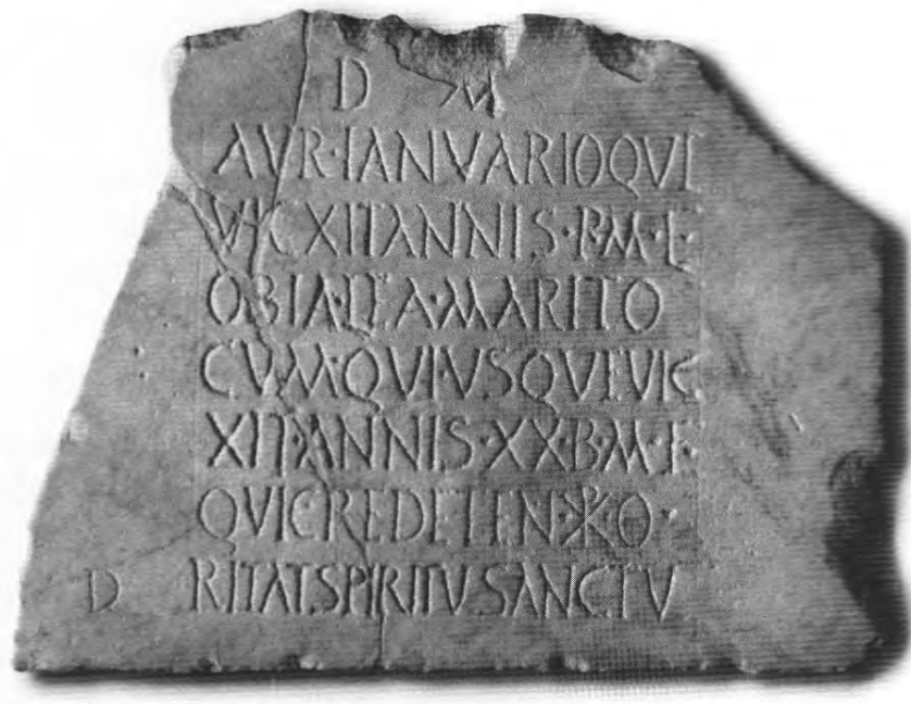
Fig. 3. Inscripció d'Aureli Januari.