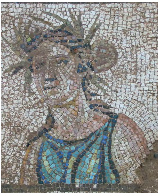
Representació de la figuració de l'estiu en un mosaic romà de la Vil·la de Santa Rosa a Corduba (Còrdova)